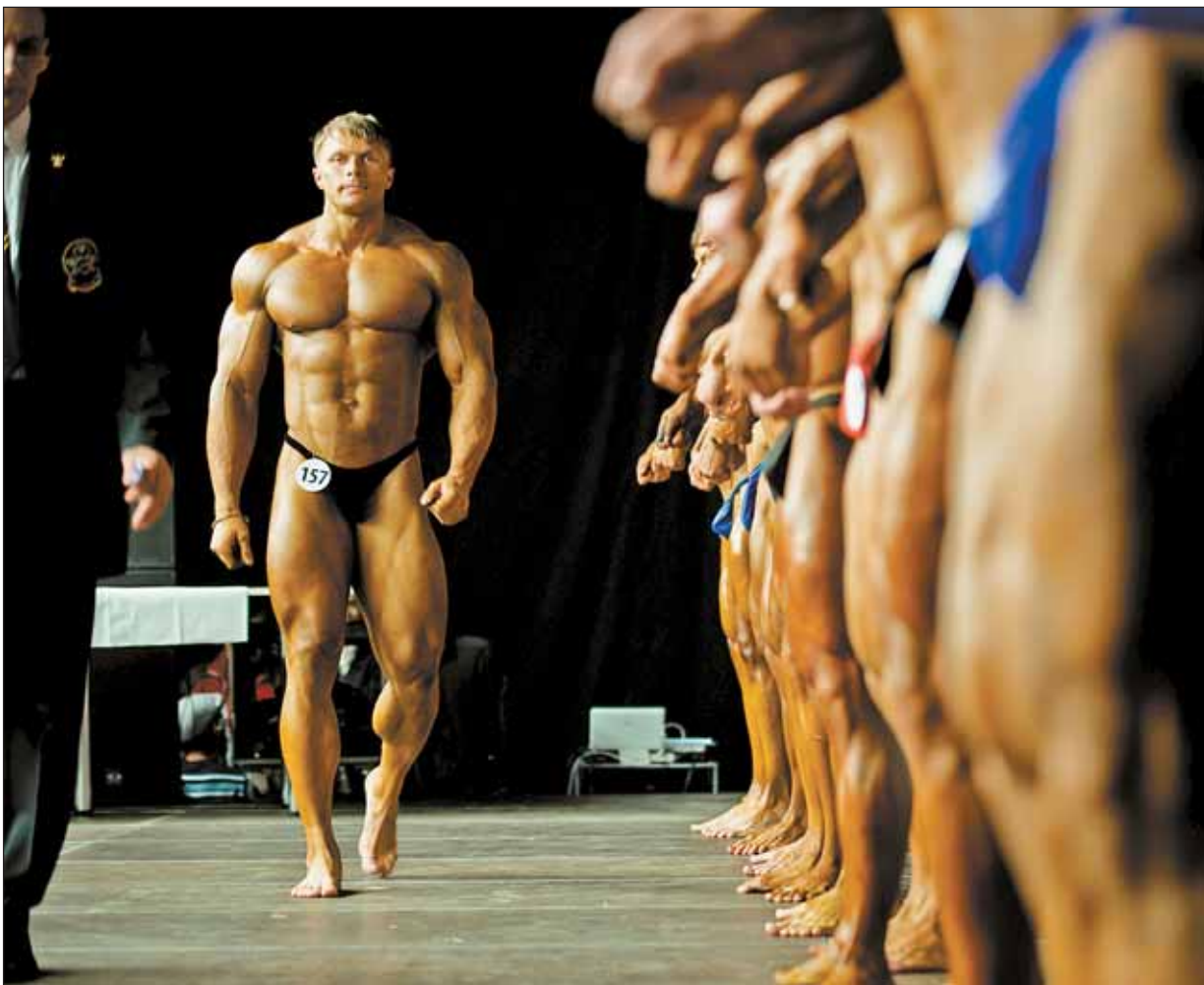
Во всей красе — участники финала