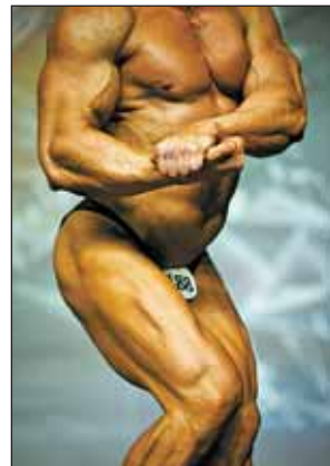
А у мужчин — объем...