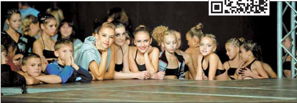
Не болельщицы, но участницы

В заключение вечера мастер-класс показал специальный гость — неоднократный чемпион США и участник «Арнольд Классик» Джонни Джексон.