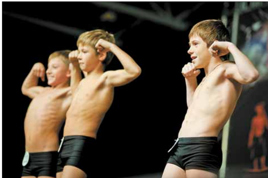
«Юный Арнольд», или Мальчиковый фитнес